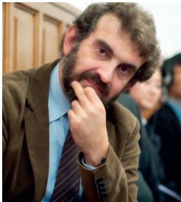
De auteur: theoloog Andrea Grillo

Vanaf de 19de eeuw heeft zich een liturgische traditie van nieuwe moderniteit ontwikkeld. In de 20ste eeuw werd deze traditie min of meer expliciet de Liturgische Beweging genoemd en bekrachtigde daarmee de sociale differentiatie (volgens Niklas Luhmann) die de Staat op onomkeerbare wijze in het Europese bewustzijn had binnengebracht. In deze complexe nieuwe context heeft de Liturgische Beweging getracht de traditie van het christelijke – met name katholieke – geloof te bewaren (en daartoe ruimte tot uitdrukking te geven), door een podium te bieden voor een oorspronkelijke en gedifferentieerde lezing van het rituele handelen. De verandering van de rol van het sacramenteel handelen is beslist een van de meest vernieuwende aspecten die de