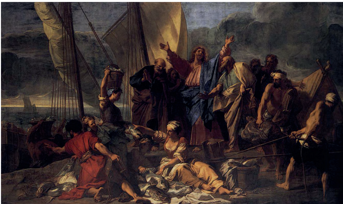
Jean-Baptiste Jouvenet, De wonderbaarlijke vangst

En dan kunnen we ons afvragen: Hoe kan ik dat weten? Ik kan toch niet in andermans hart kijken? Ik kan toch niet beoordelen of ik méér van Jezus houd dan die of die? Toch antwoordt Petrus met "Ja",