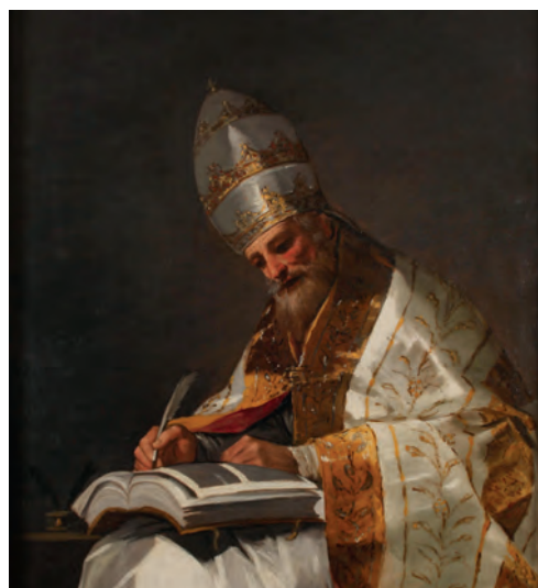
Francisco de Goya, Heilige Gregorius de Grote, paus