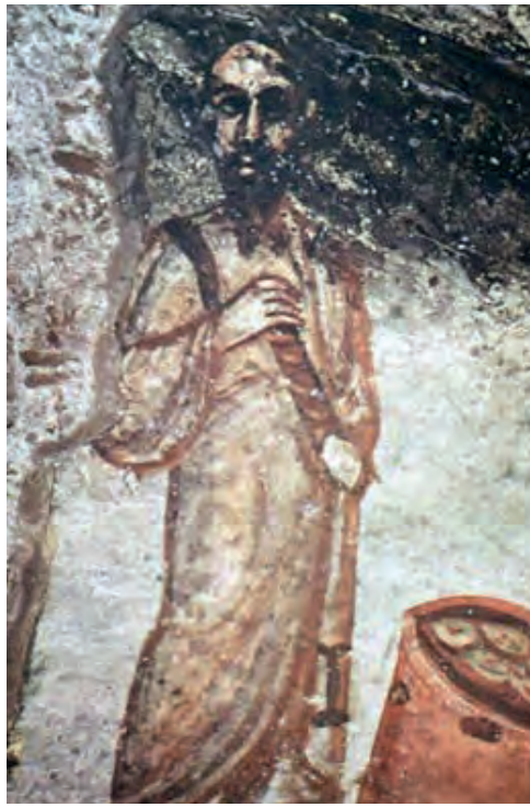
De filosoof; waarschijnlijk Sint-Paulus.

De bevrijding van de dood, vanuit de godsdiensten van de Oudheid bezien en door de mysteriecultussen beloofd,