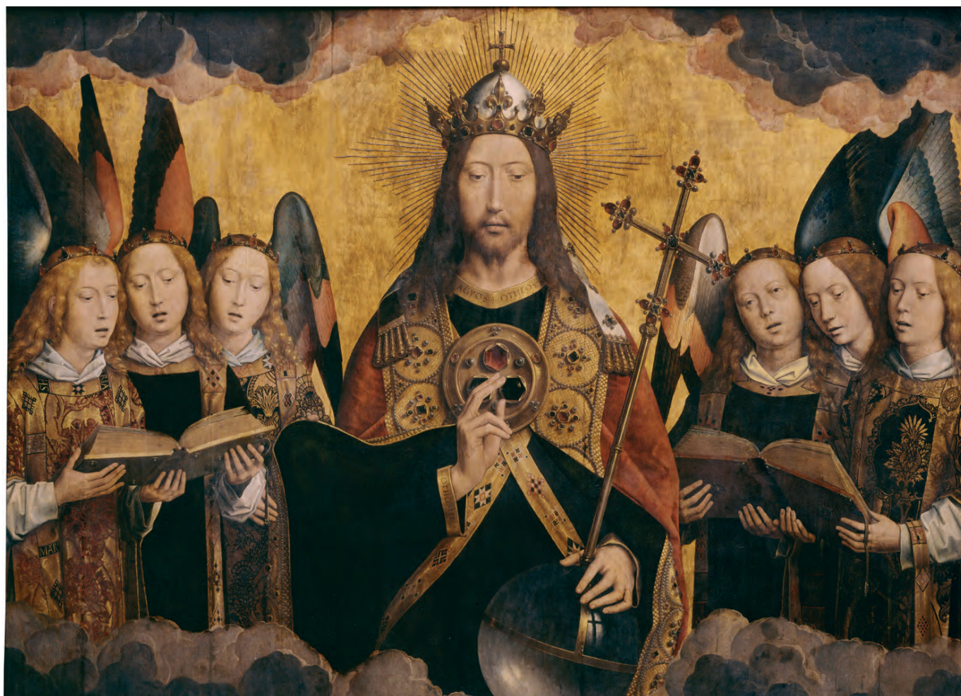
Hans Memling, Christus met zingende engelen