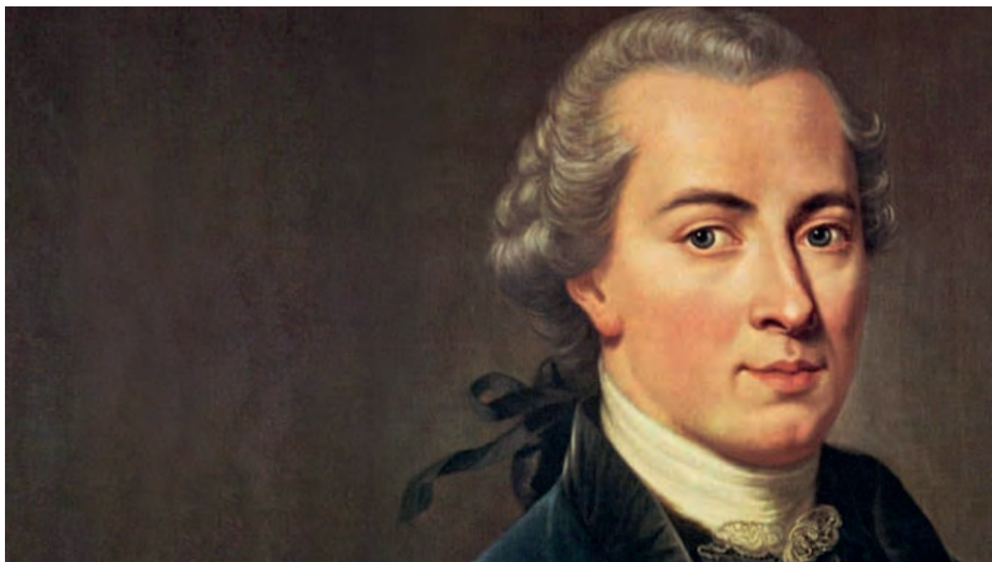
Immanuel Kant, bij wie de wil primeert boven het verstand - met alle gevolgen van dien voor het liturgiebegrip.

We dienen wel op te passen dat het leven zonder ordening niet ontaardt in spielerische Schöngesterei . Het is onjuist om uit het bovenstaande af te leiden dat de liturgie pure schoonheid is, l'art pour l'art . Waarheid komt vóór schoonheid en het betekenisvolle is meer dan vorm en uitdrukking. De ziel van het schone ligt in het ware; wie het ware en het goede zoekt, vindt ook het schone. In de liturgie gaat het primair om het eren