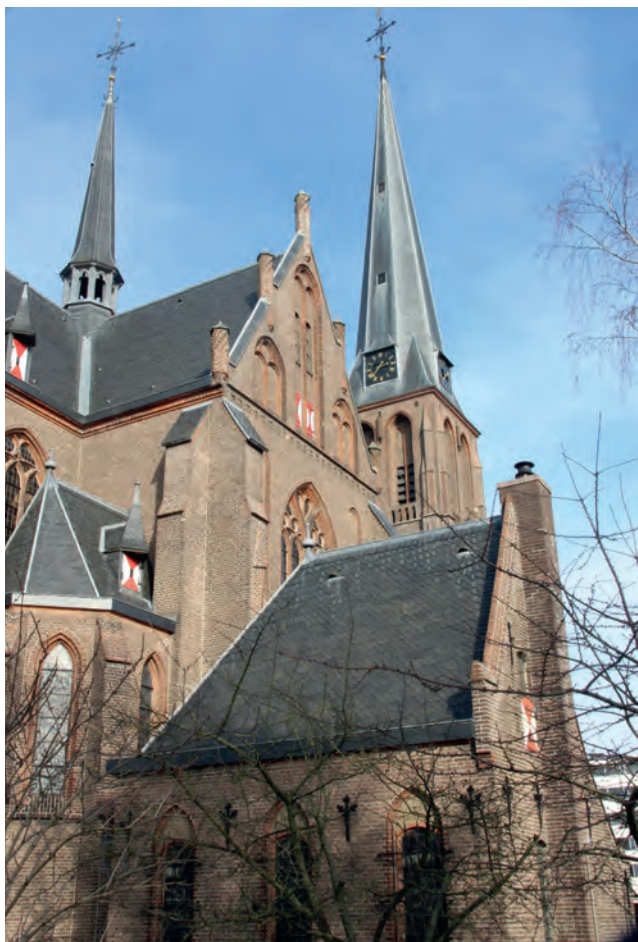
De locatie: O.L.V. Visitatie in Velp

gebied tussen Utrecht en Frankrijk. Die handschriften laten een geheel andere muzieknotatie zien dan wij twintigste-eeuwers gewend zijn. Een klein stukje uit deze muzieknotaties werd de basis van Lousberg's dissertatie, waarop hij op 26 september 2018 promoveerde. 1