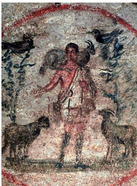
De Goede Herder.

Reeds Origenes weerlegde begin van de derde eeuw de later ook door de godsdienstcritici van de verlichting geponeerde bewering, dat de apostelen “bedrogen bedriegers” zouden zijn geweest. Door een charlatan, Jezus geheten, zouden de apostelen drie jaar lang zijn bedrogen. Door de dood van Jezus gedesavoueed, zouden de apostelen, om hun vergissing te verbergen, na de executie de boodschap hebben verspreid dat Hij opgestaan zou zijn en aan hen verschenen. Wie zou voor zo een leugen zijn leven op het spel zetten, zoals de apostelen gedaan hadden, die zich voor hun