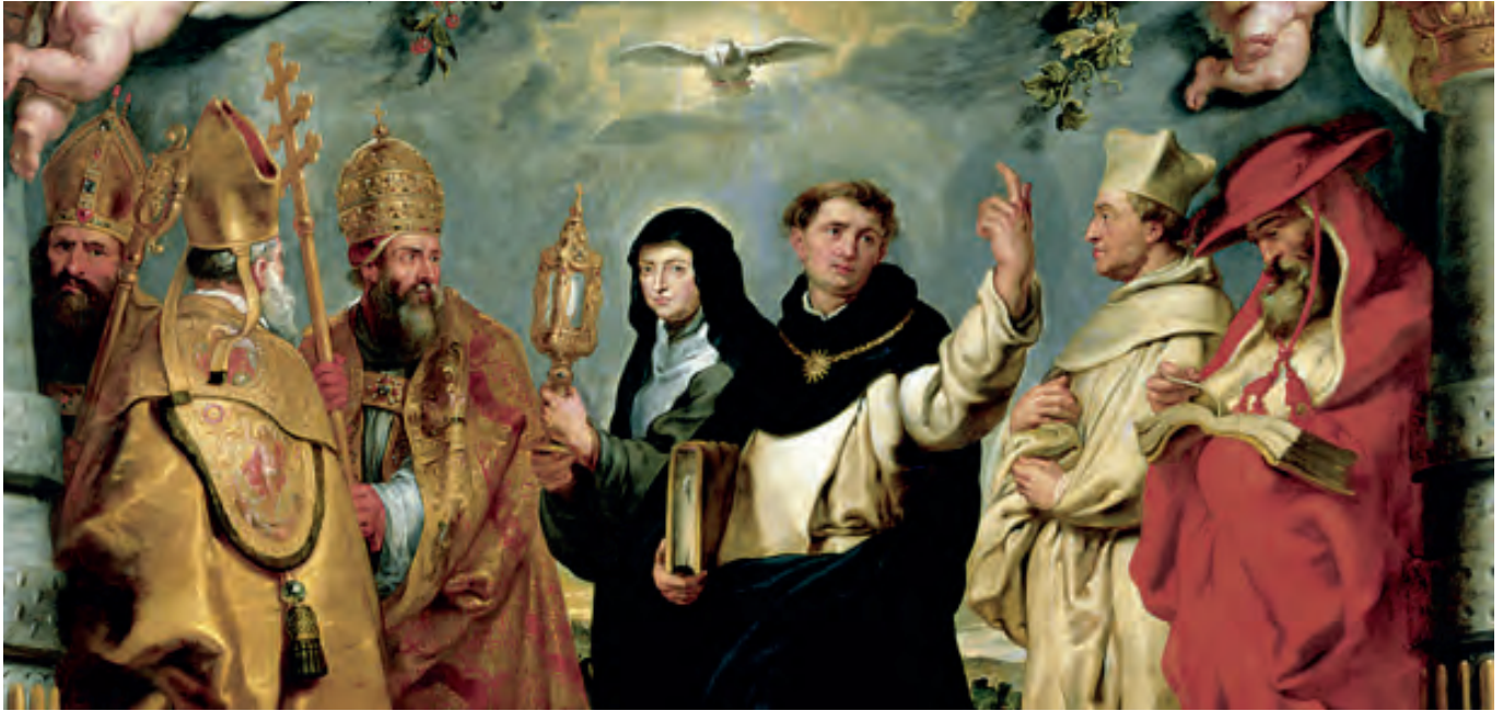
Peter Paul Rubens, De verdedigers van de eucharistie (detail). Museo del Prado, Madrid, Spanje.

het ritueel handelen ten opzichte van het juridisch en moreel handelen. Men zou zelfs min of meer kunnen beweren dat de Liturgische Beweging en de theologie van de liturgie dáár ontstaan waar de redenen van deze onherleidbaarheid van het ritueel duidelijk worden, dáár waar zij tot uitdrukking worden gebracht, en dáár waar zij beginnen met het structureren van denken en handelen van de Kerk.