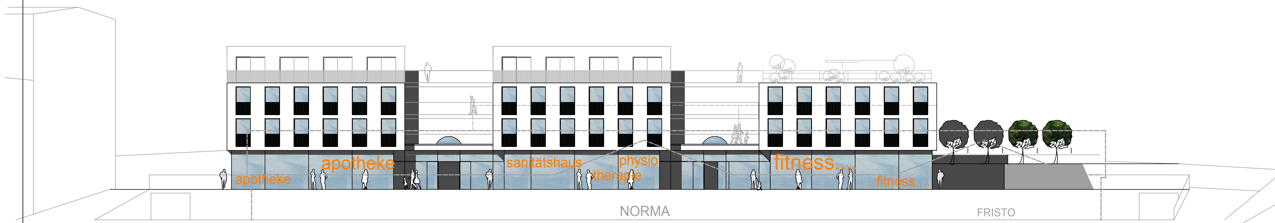
ansicht von süden