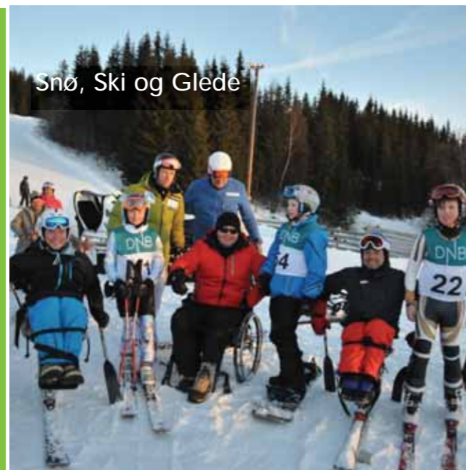
Snø, Ski og Glede

Uke 10, 03. - 07. mars blir det vinteraktivitetsuke i alpinbakkene på Hafjell. Det er et tilbud til personer med fysisk funksjonshemming. Søknad må sendes via fastlege innen 1. februar.