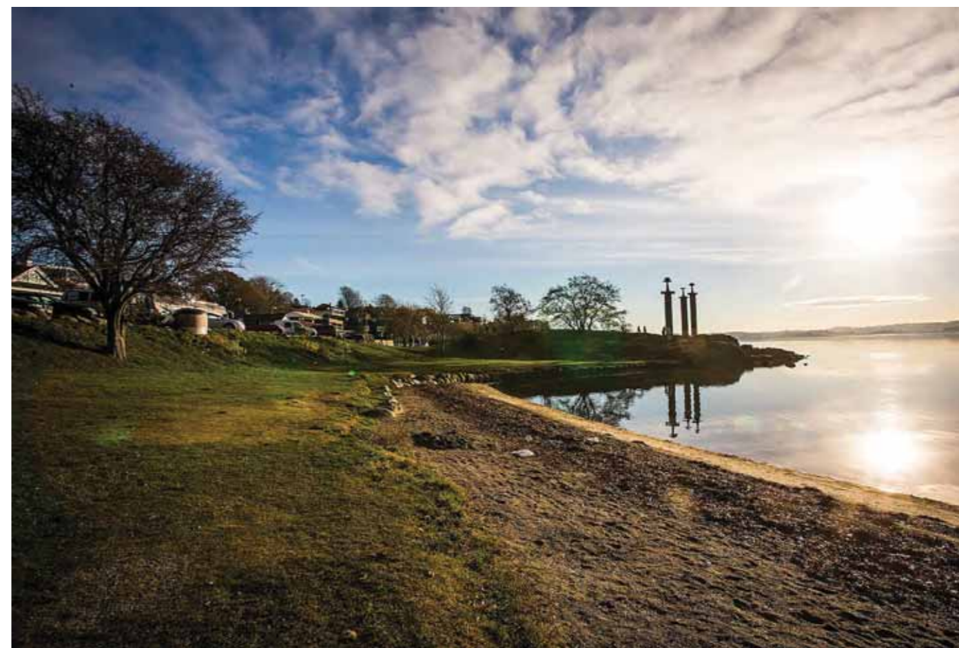
Bilder fra stavanger-området hvor løpet i Norge vil finne sted 4. mai 2014.