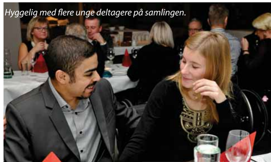
Hyggelig med flere unge deltagere på samlingen.