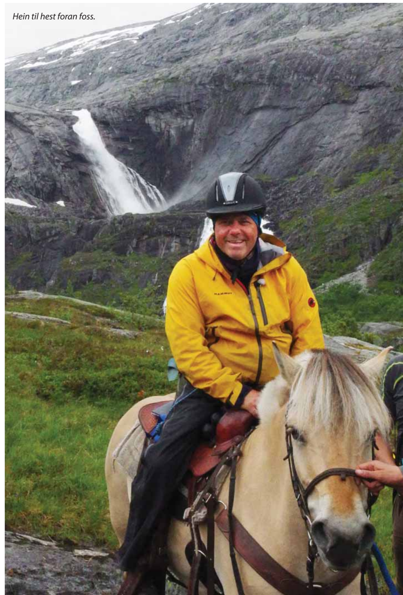
Hein til hest foran foss.

– Mye er gjenkjennbart, men selvsagt er det enormt mye som ikke kommer frem. Vi slet mer enn det som ble vist og vi lo mer enn det som kom frem. Det var en utrolig gjeng som støttet hverandre underveis og som klemte og sa oppmuntrende ord.