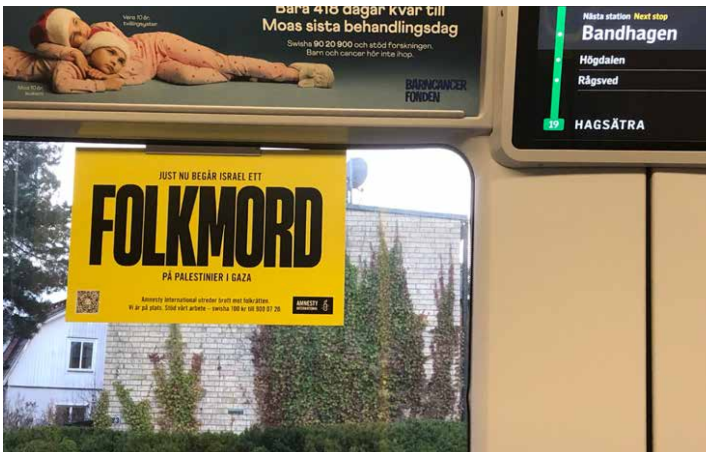
Amnesty International i Stockholms tunnelbana