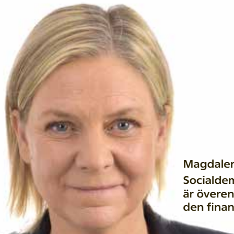
Magdalena Andersson Socialdemokraternas ordförande är överens med regeringen om den finanspolitiska ramen

https://www.aftonbladet.se/nyheter/kolumnister/a/eMq2oQ/cervenka-sverige-paminner-om-en-nojig-prepper