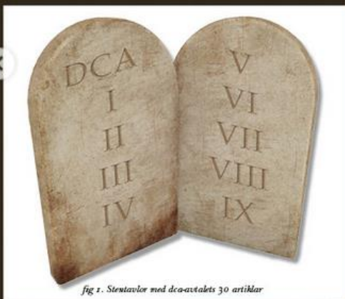
fig 1. Stentavlor med dca-avtalets 30 artiklar

Avtalets orwellska karaktär lär locka science fiction-fans från hela världen att turista i Sverige. Det kommer gynna turistnäring och skapa nya arbetstillfällen. Vi föreslår att man låter hugga in DCA-avtalet på två stentavlor som placeras vid foten av något heligt berg. I anslutning kan man låta Petter Stordalen bygga en hotell- och konferensanläggning. Den kan senare utvecklas till en så kallad theme park , med en stor digitalklocka som ständigt räknar ner tiden till 1984. Den 4:e juli varje år kan spektakulära militärparader hållas, där USA:s vapenarsenal visas upp till folkets jubel. En leende statsminister kan glänsa på hedersläktaren i sällskap av representanter för CIA.