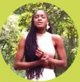
TK Speak Peace