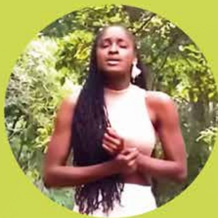
TK Speak Peace