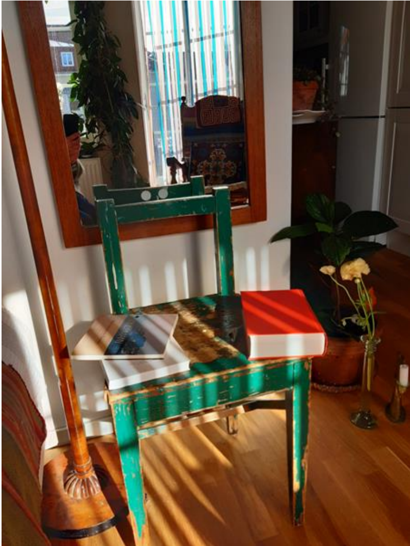
Så här ser freden ut