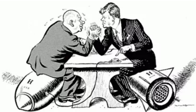
Politisk skämtteckning från 1960-talet; Nikita Chrusjtjov, USSR, och J.F. Kennedy, USA, bryter arm över kärnvapen. Upphovsman ej känd.