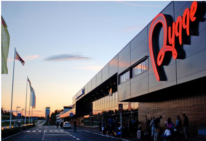
Moss flygplats Rygge, Norge.

Vi vet inte vad detta avtal kommer att innehålla men vi vet en hel del om vad ett liknande avtal som ingicks mellan USA och Norge år 2021 innebär. Låt oss nu vända blicken mot vår granne i väst.