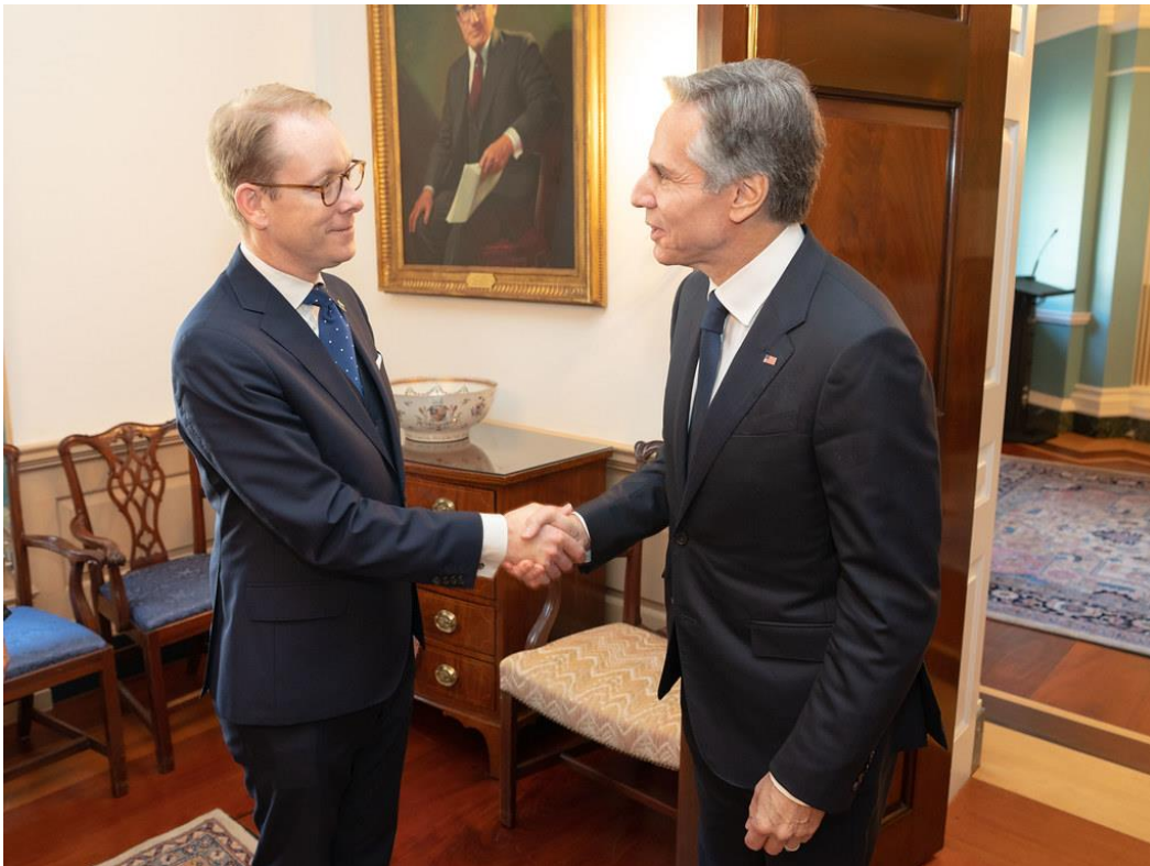
Den amerikanska utrikesministern Antony Blinken och den svenska, Tobias Billström.

Logiken bakom politikernas försäkran om att Sverige, tack vare sitt allt närmare samarbete med USA och Nato, skall bli säkrare och tryggare i denna otrygga värld, blir allt svårare att förstå. Framför allt när grunden i detta transatlantiska samarbete vilar på en kärnvapendoktrin. Vad, till exempel, kan det innebära i praktiken att en självständig nation avsäger sig rätten att på eget territorium inspektera amerikanska fartyg, flyg eller civila fordon? Eller att USA kommer att få lagra vapen på för världsländet hermetiskt tillslutna baser? Vad innebär det att USA får fri led till och från sina baser? Moderna kärnvapnen är nätta uppfinningar, lätta att hantera och transportera – på fordon, i flygplan, på fartyg. Att flyga ett lass kärnvapenmissiler till Rygge och förvara dem där eller att köra några kärnvapen på landsvägen mellan Rygge och Evenes – vem i världsländet ska ha koll på det? Hur blir det om även Sverige, Finland och Danmark skriver under avtal som liknar det norska? Blir vi tryggare och säkrare då? Omgivna av utländska militäranläggningar som kan härbärgera massförstörelsevapen?