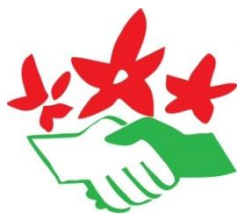
NATURFREUNDE AMIS DE LA NATURE NATUREFRIENDS INTERNATIONAL