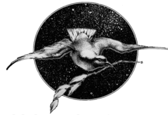
Global Network Against Weapons and Nuclear Power in Space