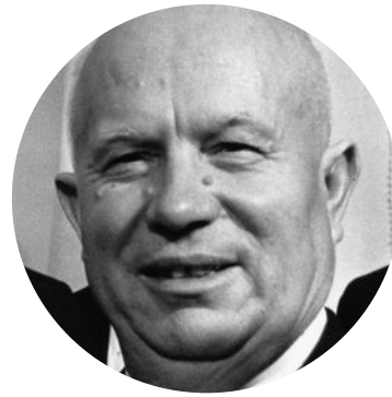
Nikita Chrusjtjov var Sovjetunionens ledare från 7 september 1953 till 14 oktober 1964.

I oktober 1962, när Chrusjtjov hade ”blinkat” och packat ihop de sovjetiska missilerna, sågs John F Kennedy som den store segraren. Han hade visserligen spelat högt – försatt amerikanska kärnvapentrupper i 15 minuters beredskap – men till sist fått motståndaren att ge med sig.