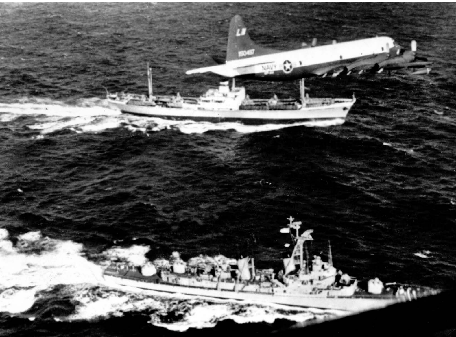
November 1962: Amerikanska jagaren Barry närmar sig ett sovjetiskt fraktfartyg för att inspektera dess last - troligen missiler som fraktas hem från Kuba. Det sker dagar efter den kris som var nära att utlösa ett tredje världskrig.