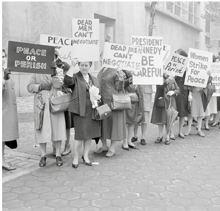
"President Kennedy - var försiktig!" Fredsdemonstration utanför FN-högvarteret i New York under Kubakrisen.