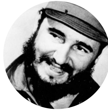
Fidel Castro styrde Kuba först som premiärminister 1959-1976 och därefter som president från 1976 till 2008