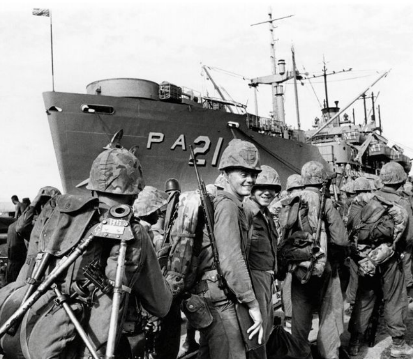
Amerikanska marinsoldater på väg hem från basen på Guantánamo i december 1962 efter upplösningen på Kubakrisen.