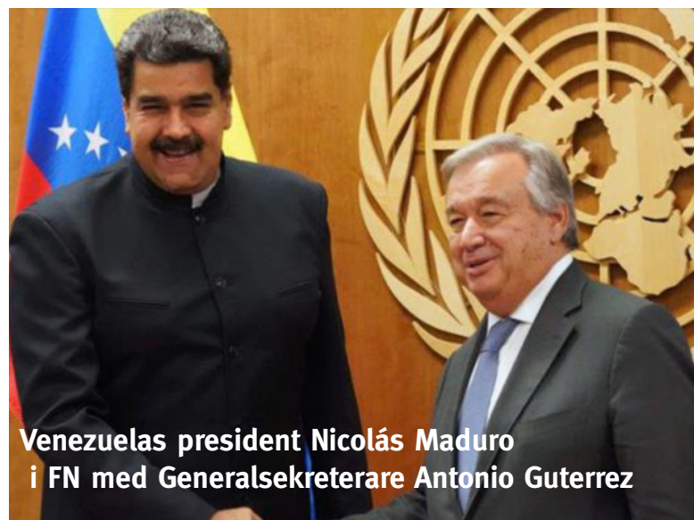
Venezuelas president Nicolás Maduro i FN med Generalsekreterare Antonio Guterres

Maduro avslutade med att upprepa sin vilja till samtal. Han bad Mexiko, Uruguay, Bolivia och de karibiska länderna i Caricom om hjälp att återuppta sitt initiativ för en dialog mellan regering och opposition