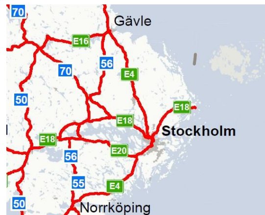
Figur 2. Karta över det nationella stamvägnätet, Trafikverket

Statlig medfinansiering är finansiering ur nationell eller regional plan till vissa typer av åtgärder som genomförs av annan än planupprättaren. Objekt som ligger på det kommunala vägnätet kan till exempel få statlig medfinansiering från planen med upp till 50 procent. Detsamma gäller för medel till kollektivtrafikåtgärder liksom till trafiksäkerhets-, miljö-, och cykelåtgärder, där Region Uppsala (som är den regionala kollektivtrafikmyndigheten i Uppsala län) eller kommunerna kan få medfinansiering från planen med upp till 50 procent. Både Region Uppsala och kommunerna kan ansöka om medel från de åtgärdsområden som är avsedda för statlig medfinansiering. SFS förordning (2009:237)