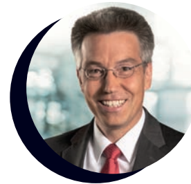
Otto Lederer Landrat des Landkreises Rosenheim