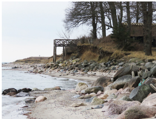
Tv: Nedergaards hovedbygning. Th: Udsigtsplatform på stranden.