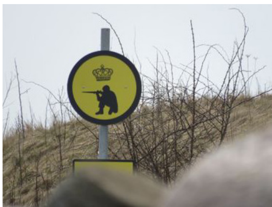
Advarsel: Her skydes. Gå på stranden!

Gå langs kysten - færdsel på stien mellem stranden og skydebanerne er forbudt.