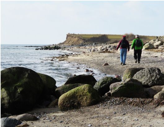
På vej mod Snøde Øre.

81. Hesselbjerg Stubhave. Følg stien gennem den lille skov, som dyrkes efter gamle principper - ca. hvert tyvende år skæres træerne tilbage. Stubhave, gærdselsskov eller stævningskov kaldes denne type bevoksning.