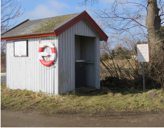
Toiletbygning ved Snøde Strandvej.

79. Snøde Strandvej. Etape 9 begynder for enden af Snøde Strandvej, hvor der er en p-plads og et offentligt toilet.