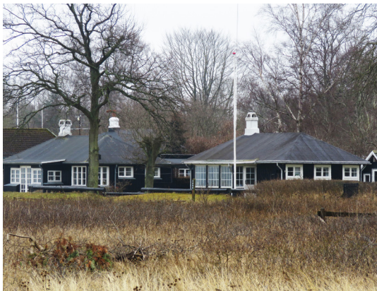
Husene i Københavnerkolonien er bygget ca. 1920.