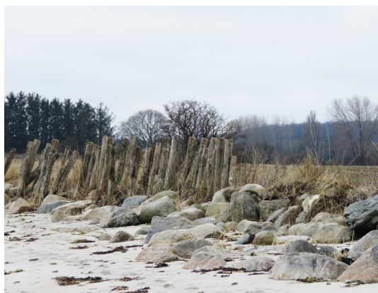
Flere steder på østkysten, f.eks. ved Bastemose, står disse mærkelige stolper. Hvad mon de har været brugt til?