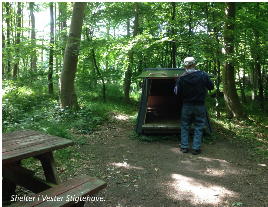
Shelter i Vester Stigtehave.

LANGELAND RUNDT En vandretur på 138 km 10 etaper a 10-19 km