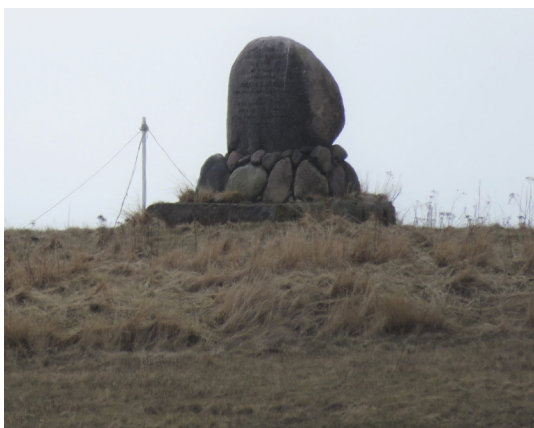
Mindesten på toppen af Andemosehøj.

76. Københavnerkolonien. Gå videre til Langelands nordligste punkt. Fra p-pladsen her fører en fin sti rundt om nordspidsen forbi det sommerhusområde i Hou Plantage, som kaldes Københavnerkolonien.