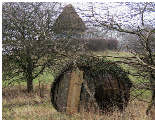
På stranden ved Charlottenlund ligger et fint, lille tøndehus. Det er privat, så lad være med at gå ind i det.

73. Find vej til shelters. Ca. 1 km nord for havnen når du en stor, åben opholdsplads med bålsted - lige ned til stranden. Her står et skilt, som viser vej til to to-personers-shelters, såkaldte skrubber, om ligger ca. 150 meter inde i skoven. Gå videre langs stranden, hvis du ikke skal overnatte.