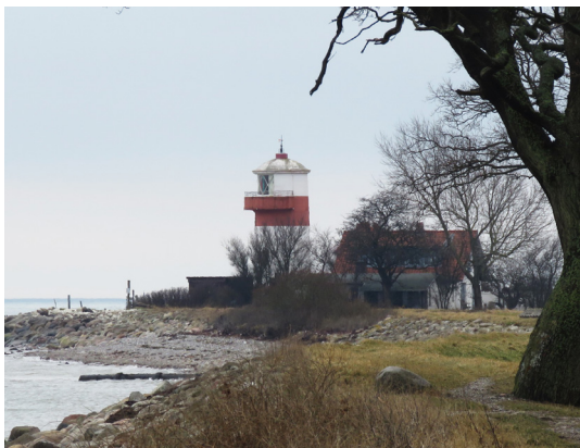
Hou Fyr med det røde mavebælte har siden 1892 guidet søfarende gennem Langelandsbælt.