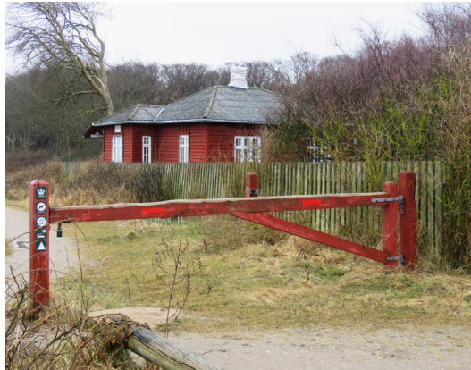
Havnekontoret i Lohals (tv). Bag den røde bom (th) fortsætter en sti ind i skoven Vester Stigtehave.