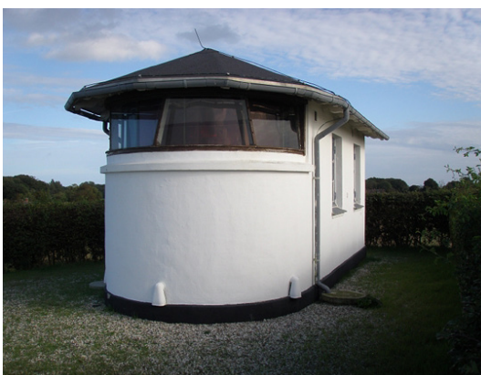
Frankeklint Fyr gør ikke meget væsen af sig.