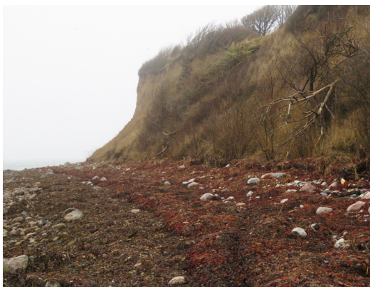
Frankeklint på Langelands nordvestkyst.

75. Frankeklint og fyr. Frankeklint Fyr, som blev anlagt i 1894, er lille og uanseeligt. Fyret er fuldautomatiseret, og overvågningen af anlægget overgik allerede i 1975 til Fornæs Fyr, som ligger på Djursland, på Jyllands østligste punkt.