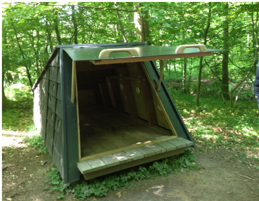
Det ene af to små shelters - skrubber - i Vester Stigtehave.

72. Lohals. Etape 8 begynder ved havnekontoret på Lohals Havn. Lige nord for fiskerihavnen går en smal sti ned til kysten. Fortsæt langs vandkanten, indtil du ser de røde bomme ved indgangen til skoven Vester Stigtehave. Nu træver du ad stier i skovkanten eller på stranden mod nordøst. Skoven ejes af Naturstyrelsen (den danske stat), og her står århundredgamle, krøllede ege helt ud til havet sammen med knortede bøge.