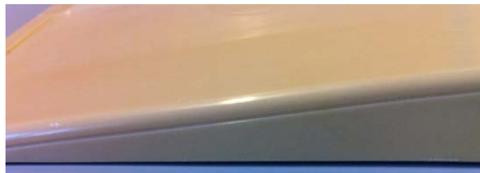
Här har Lanat Spackel formats till en kil.

Denna produkt kan användas för att laga skador i betongen men också för att utjämna nivåskillnader när betongen ligger i olika nivåer. Produkten är tixotrop vilket möjliggör utformning av en kil. (bild t h) Att produkten är tixotrop gör den även lämplig för genomgående öppna fogar där andra produkter inte fungerar.