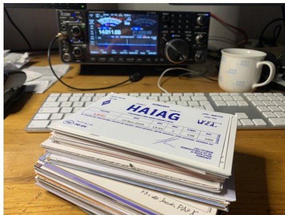
Figur 5 Siste QSL forsendelse

Det hadde vært interessant å samkjøre disse data med data knyttet til nordlys forhold.