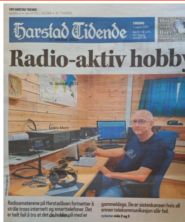
Figur 1 LA9YBA - Leder LA1H på forsiden av HT

NRRL har også forespurt om de kan arrangere sin generalforsamling i forbindelse med vår arrangering av NNHM 2024.