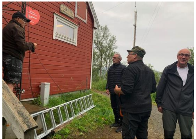
Figur 3 Stasjonsbestyrer og dugnadsgjeng i farta