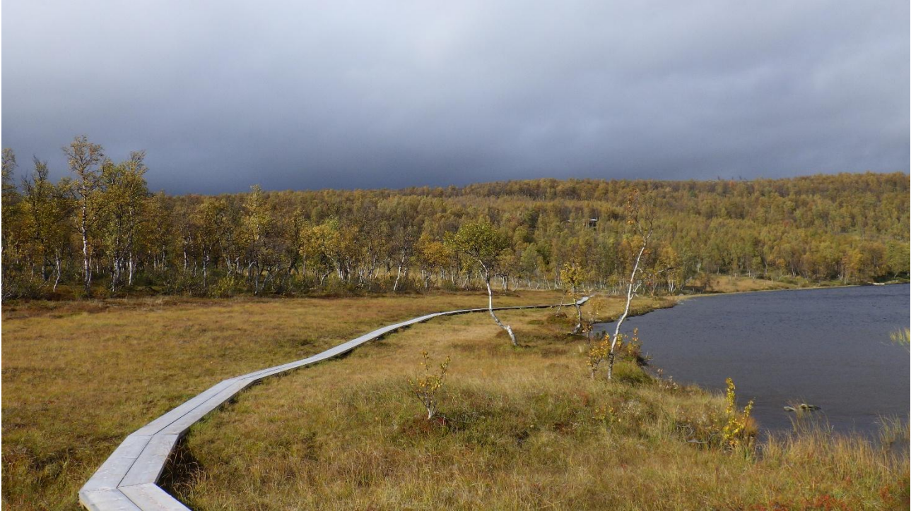
Klopper langs Svartsjøen

Her startet vi opp med klopplegging av naturstien langs Svartsjøen i 2023, men det gjensto noen meter for å komme helt i mål. I 2024 ble resten av kloppene lagt ned og prosjektet ferdigstilt. Prosjektet var bestilt av Nasjonalparkstyret for Forollhogna. KUR inngikk også en to-årig avtale på tilsyn av infopunktet v. Svartsjøen pålydende kr. 15 000,- pr. år.