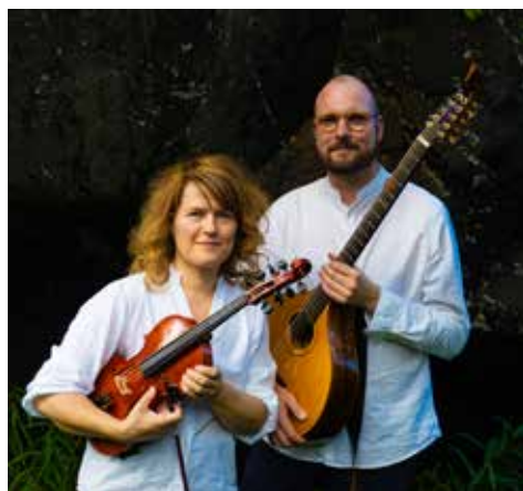
Konsert Aaret Duo Esbensensgården