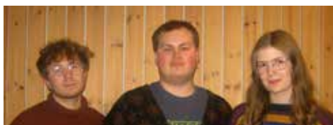
Vesivuosi – Vannåret Jazzkonsert på Kooperativet kulturscene