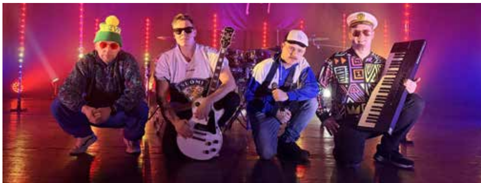
Norges beste finske band – Eisa Peita