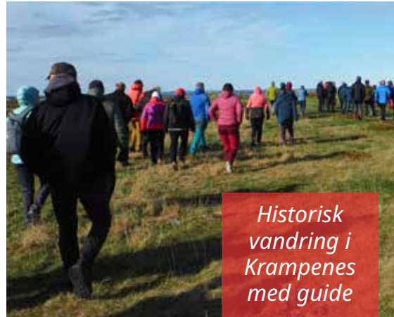
Historisk vandring i Krampenes med guide