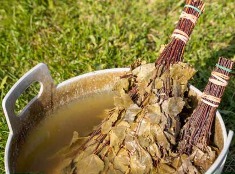
Saunafest i Ytrebyfjæra - Vadsø. 4 mobile saunaer og telt til å skifte i (lavvu).