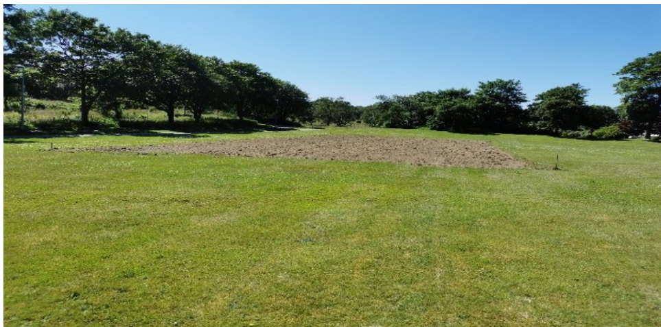
Stedet med vilde blomster på vej ud fra Lindelunden.

Ved spørgsmål om randbeplantningen mm. kontakt grundejerforeningen (se side 2)