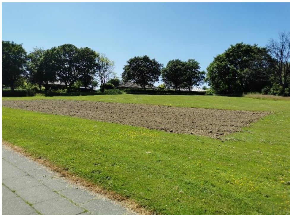
Stedet med vilde blomster fra Nøddelunden.