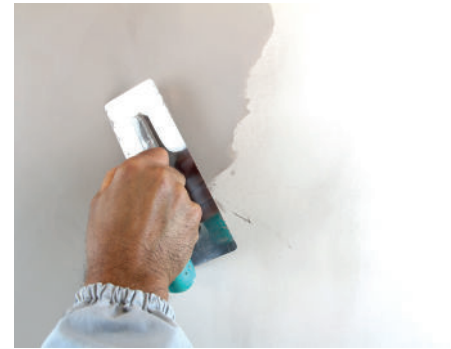
VeneziaV Zweiter Anstrich