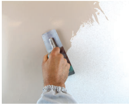
VeneziaV Erster Anstrich