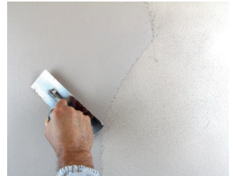
VeneziaT Zweiter Anstrich