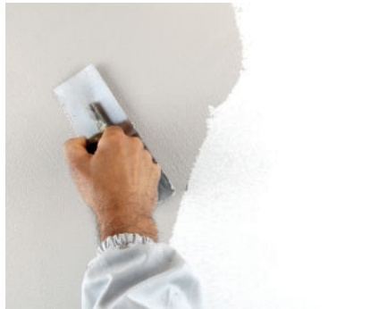
VeneziaT Erster Anstrich