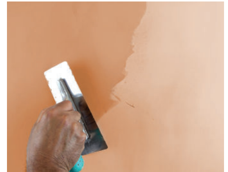
VeneziaG Zweiter Anstrich