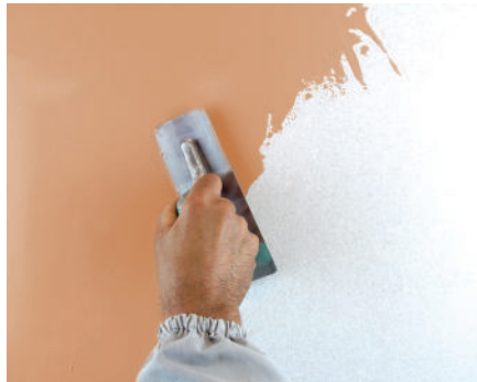
VeneziaG Erster Anstrich