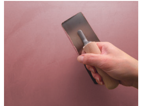
Velluto Zweiter Anstrich