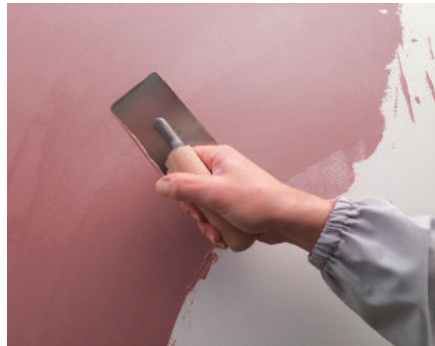
Velluto Erster Anstrich