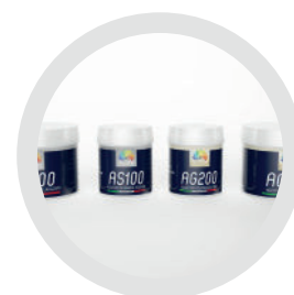
AS 100 - AG 200