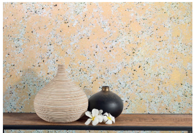
Nubilia M Dual Color - Gold