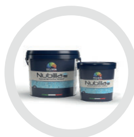
Nubilia M Dual Color