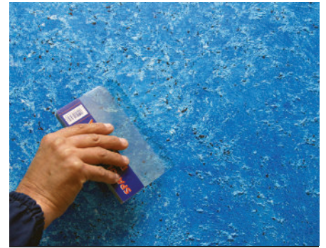
Zweiter Anstrich spatola doppia lama cod.1016