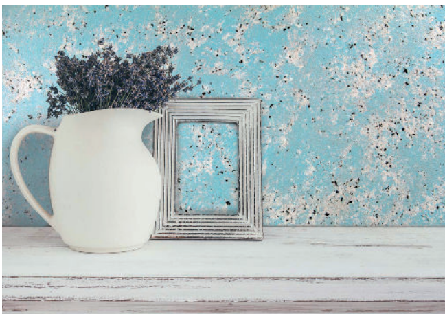
Nubilia M Dual Color - Silver