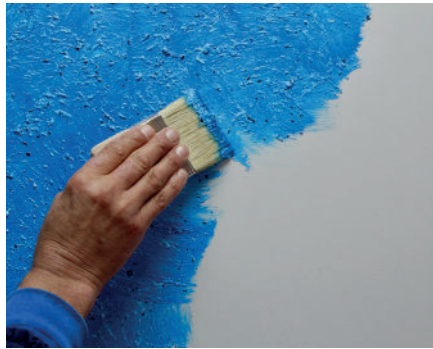
Erster Anstrich pennello codice 1017