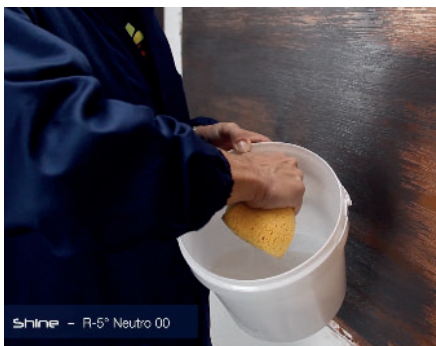
Shine (Waschen mit Wasser)