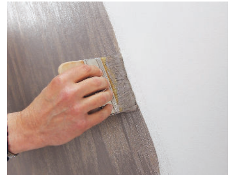
Kalahari medium/small Diagonaleffekt