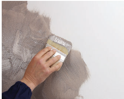
Kalahari medium/small Kreuzeffekt