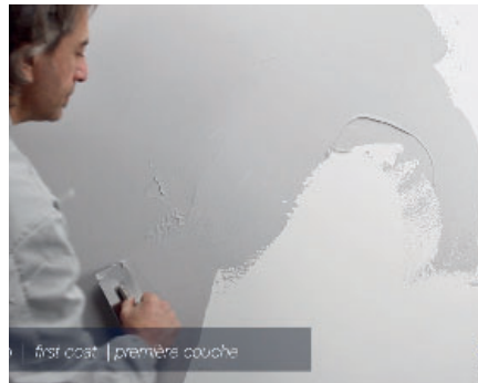
Materix 3.5 Erster Anstrich