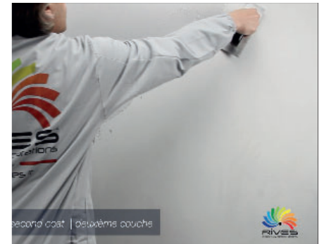
Materix 3.5 Zweiter Anstrich