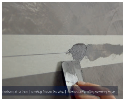
Erstellung von Linien