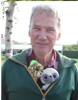
En del fynd vill man bära nära sig.

Jag kapade åt mig ett loppisfynd av den kända engelska gatumålaren Banksy för 20 spänn. Ett "fynd"!?