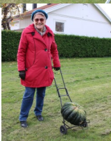
Årets stolta pumpavinnare.