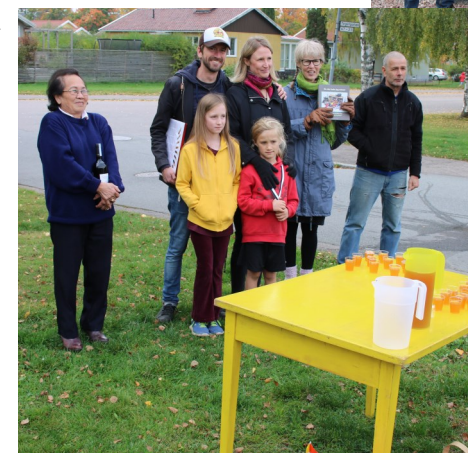
Stolta vinnare vid prisbordet.