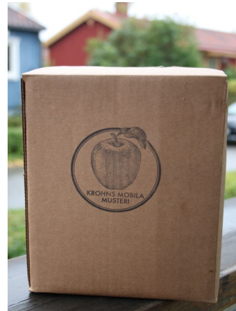
Full fart i musteriet!