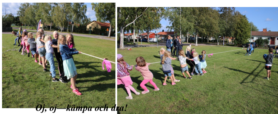
Oj, oj—kämpa och dra!

6 Vill du se alla bilderna i färg från solrostävlingen och föreningsfesten hittar du hela tidningens innehåll i Smästugebladet på vår hemsida.