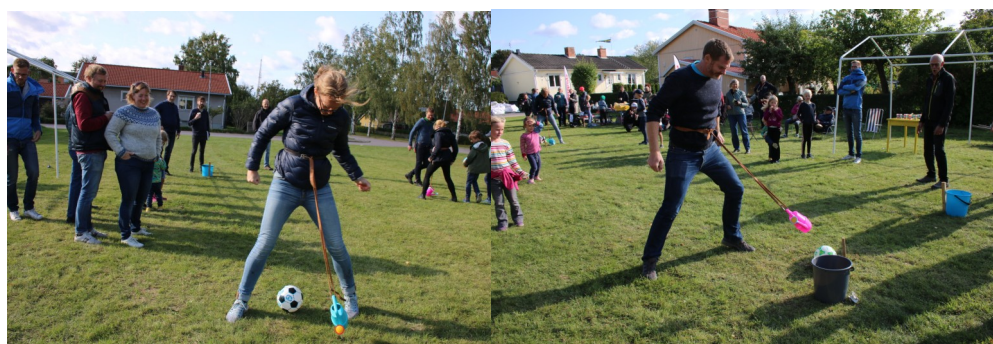
Barnsligt roligt också för föräldrarna. Men vad gör de?