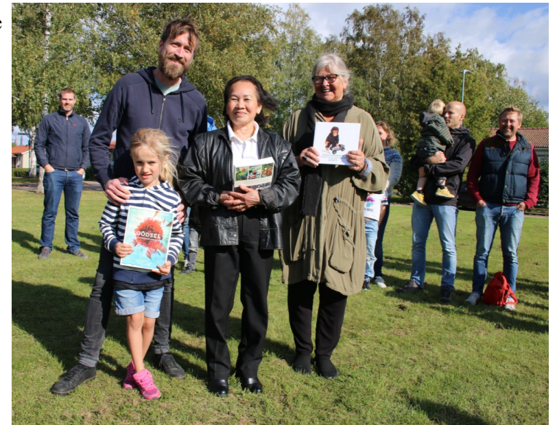
Glada pristagare på Lecheplätten