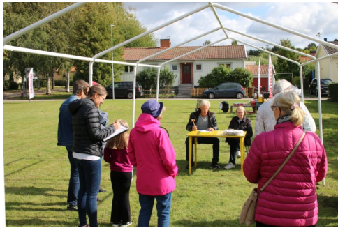
Högt till tak. Föreningens styrelse tillsammans med medlemmar (få tyvärr) klubbade de nya stadgarna.