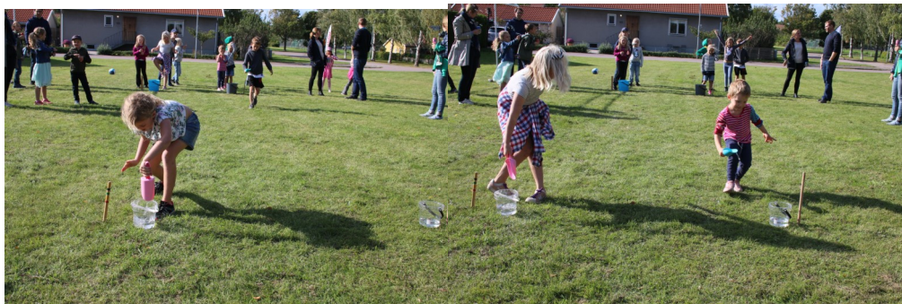
Vattenlek är busroligt.