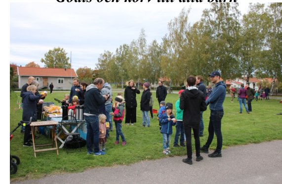
Trevligt samkväm på Lecheplätten