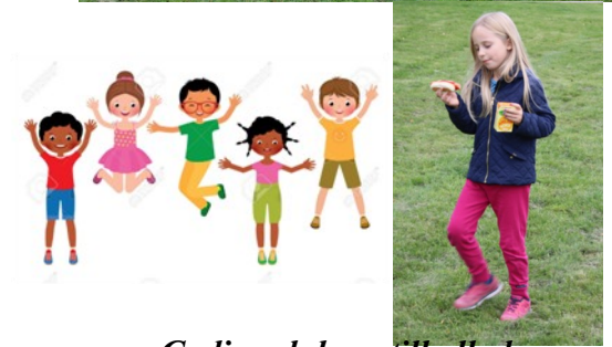
Godis och korgv till alla barn