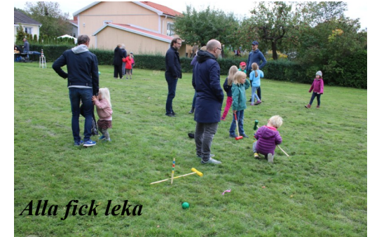
Alla fick leka

Det är en gemenskap som kan öppna upp för och kan stärka umgänget mellan barn och grannar i vårt fina bostadsområde.