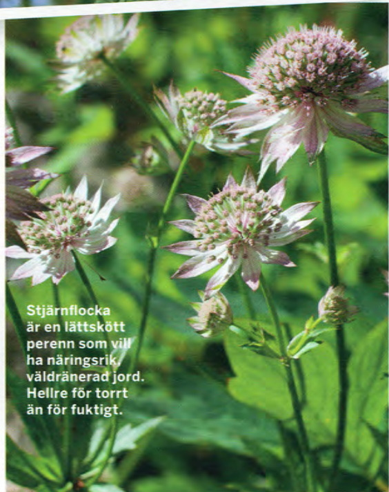
Stjärnflocka är en lättskött perenn som vill ha näringsrik, väl-dränerad jord. Hellre för torrt än för fuktigt.