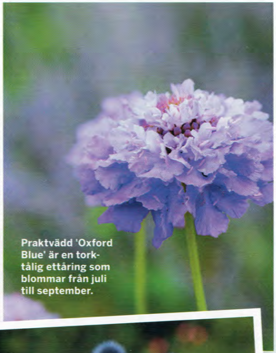
Praktvädd 'Oxford Blue' är en torktålig ettåring som blommar från juli till september.