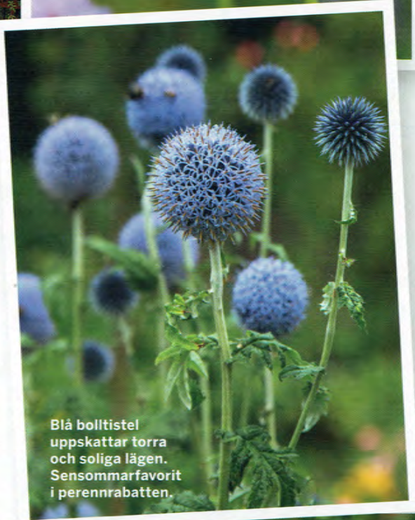
Blå bolltistel uppskattar torra och soliga lägen. Sensommarfavorit i perennrabatten.