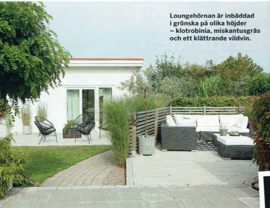
Loungehörnan är inbäddad i grönska på olika höjder – klotrobinia, miskantusgräs och ett klättrande vildvin.