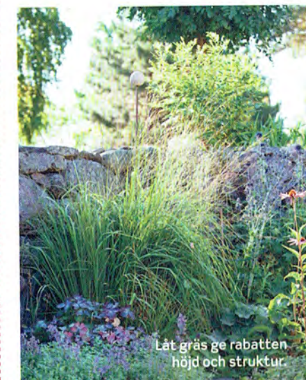
Låt gräs ge rabatten höjd och struktur.

PRYDNADSGRÄS är ett fantastiskt träd- gårdsinslag, och med sina varierande karaktärer kan de användas på många sätt. Med allt från fem meter hög bambu till låga marktäckande arter finns det ett gräs för varje sammanhang. Gräs används ofta som ett blickfång i perennrabatten, men många står sig också fint som solitärer i krukor.