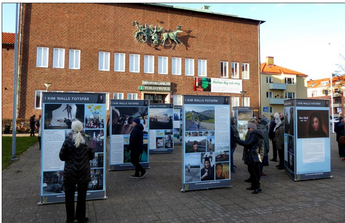
Vernissage utanför Ystad konstmuseum.