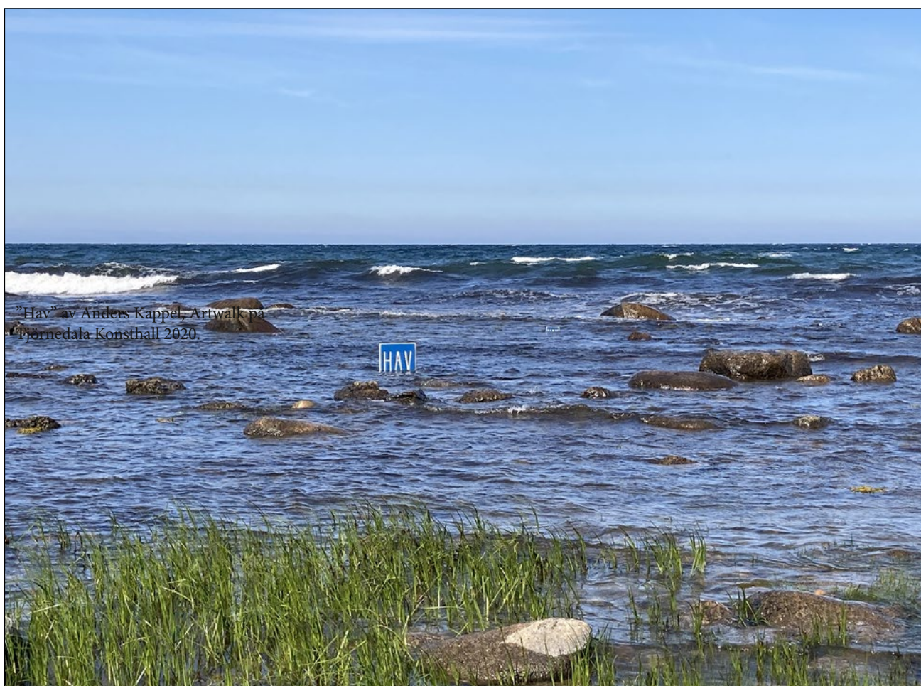
"Hav" av Anders Kappel, Artwalk på Tjörnedala Konsthall 2020.

Utifrån materialet kan vi tro oss se att Simrishamns position som kulturkommun skulle stärkas av att ha fler offentliga kreativa lokaler och en ökad dialog med KKB-företagen. Det har även framkommit tydliga önskemål om gemensam marknadsföring alternativt gemensam distribution av kommunikationsmaterial.