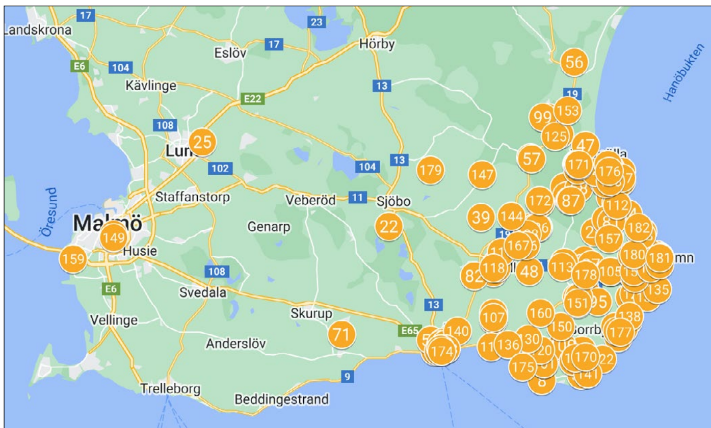
Geografisk spridning av medlemmar i Kulturnavet Österlen, september 2023.

Sydöstra Skåne är föreningsstätt. Varje kommun har sina egna föreningsregister, men registren begränsar sig till den egna kommunen. Vid intervjuerna framkom att framför allt arrangörsföreningar skulle välkomna ett gemensamt föreningsregister för att bättre kunna samordna sig och samarbeta. Eventuella svårigheter gällande GDPR måste naturligtvis beaktas.