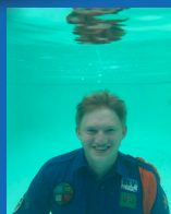
Largo Herbosch 0499/72 27 31