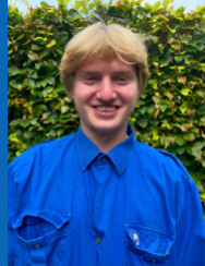
Largo Herbosch 0499/72 27 31