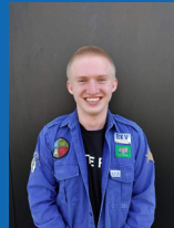
Largo Herbosch 0499/72 27 31