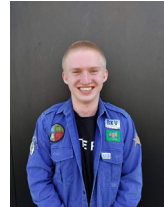
Largo Herbosch 0499/72 27 31