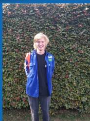
Largo Herbosch 0499/72 27 31