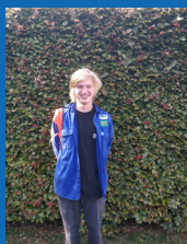
Largo Herbosch 0499/72 27 31