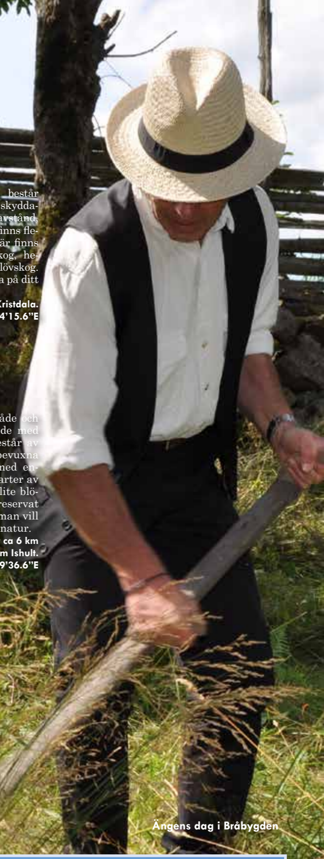
Ängens dag i Bråbygden

Vägbeskrivning: Ängsmossen ligger ca 6 km nordost om Ishult. GPS: 57°29'44.5"N 16°19'36.6"E