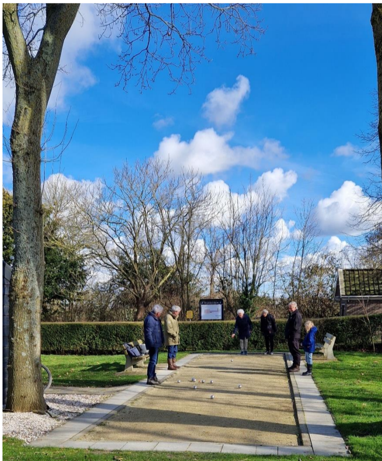
Jeu de Boulen in Krabbendam

“Die tijd ligt achter me”, zegt Ton tegen mij wanneer we elkaar spreken, “maar er gebeuren nu weer andere mooie dingen. Nu ik er alleen voor sta en de jaren gaan tellen, werd de stolp me veel te groot en te bewerkelijk. We hebben hier altijd met veel plezier gewoond, dat blijkt ook wel uit het feit dat één van de kinderen graag in de stolp wilde komen wonen.” Voor degenen die met regelmaat over de dijk lopen of fietsen is het beeld inmiddels bekend. Onderaan de dijk, achter de boerderij, verscholen achter prachtige knotwilgen staat een nieuwe woning. Ton woont niet meer in de boerderij, maar wel op zijn eigen erf. “Je kunt je voorstellen dat ik heel blij ben met deze prachtoplossing. Bovendien wordt de stolp door de nieuwe generatie aangepakt, zoals wij dat ook hebben gedaan, vijftig jaar geleden.”