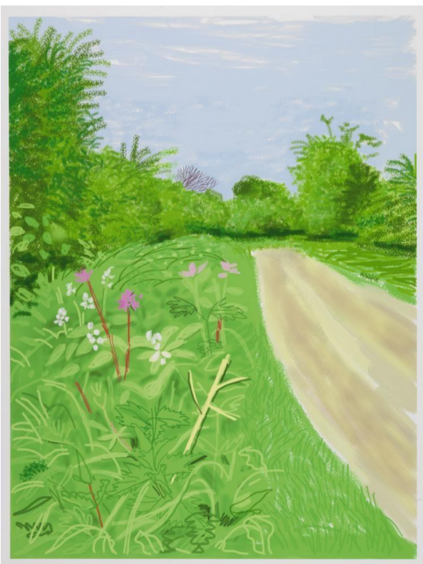
David Hockney, the arrival of spring, 2011