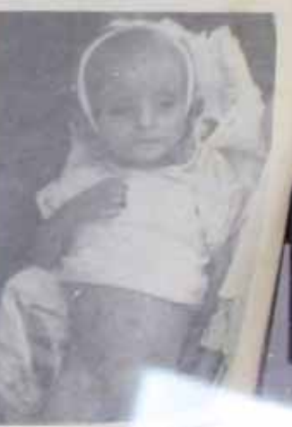
TRANSPORTI SMRTI: Izveštaj Velike Župe Bilogora o progonu 16.500 Kozarčana, uglavnom žena i dece, u Grubišno Polje i Garašnicu