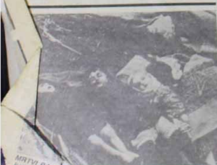
MRTVI RAZIŠTI SAMO JEZIK CVEČA: Ubijene kozarčice