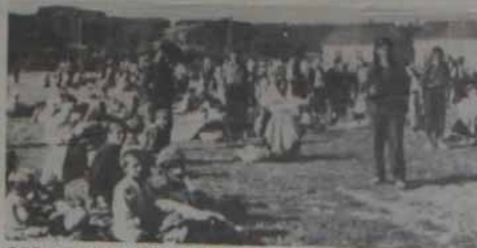
POD VEDRIM NEBOM: Hiljade Kozarčana umoreno je žedu i gladu