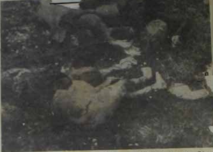
FAŠISTIČKI TRIJUMF ZLA: Deca ubijena u logoru Starogradiška