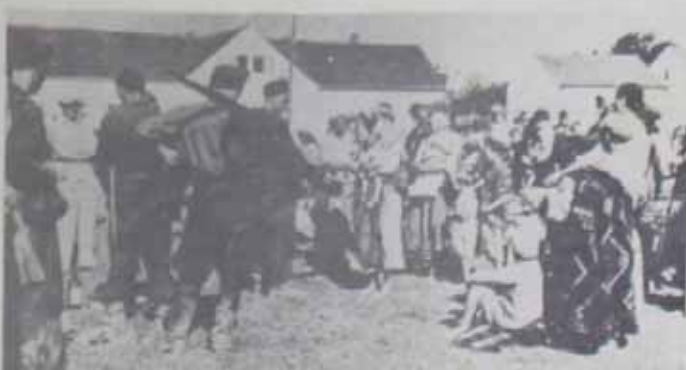
SUROVA ODMAZDA: Posle ofanzive na Kozaru, jula 1942. godine u logore je transportovano 68.500 Kozarčana. Na fotografiji je transport upućen u Grubišno polje