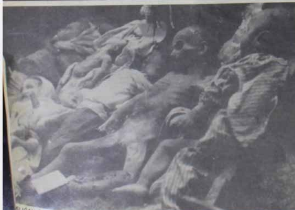
SLIČAN ŽIVOTU LIŠCA ŽIVOT JE LJUDI: Umoreni kozarački mališani u logoru u Sisku