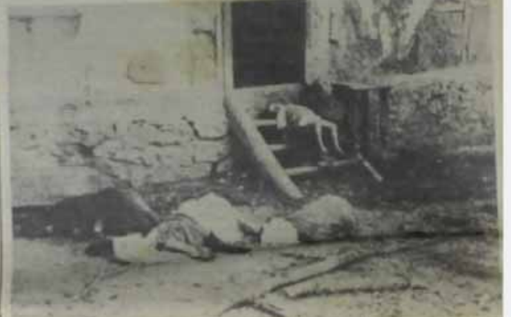
I U SMRTI ZAJEDNO: Majka sa ubijenom decom u selu Dra- gelji kod Bosanske Gradiške, septembar 1943.