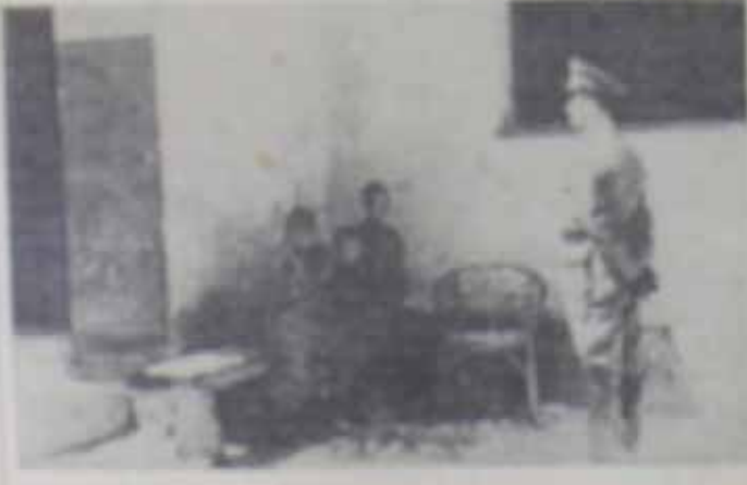
LISTAŠKI PIREKI BUD; Poveljcaz oficir ispljuje male zateka- nika u logoru Jastrebarsko