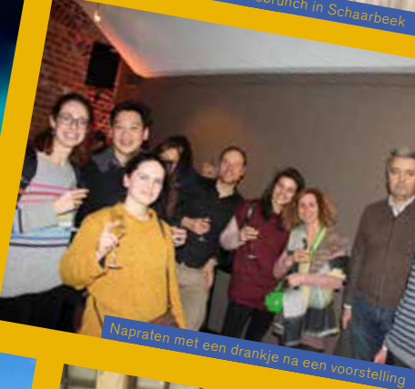
Napraten met een drankje na een voorstelling