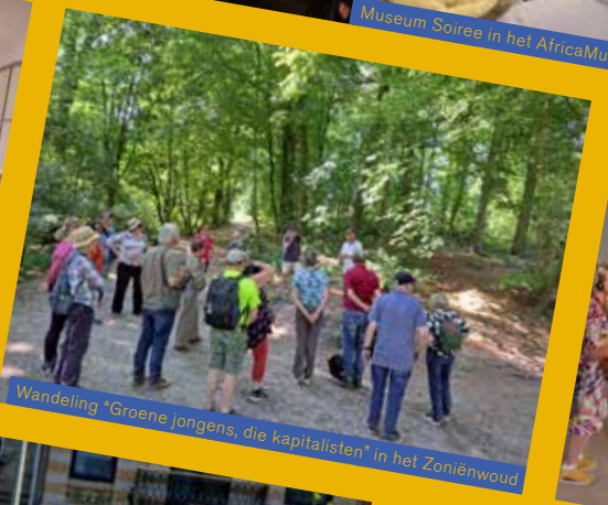
Wandeling "Groene jongens, die kapitalisten" in het Zoniënwoud