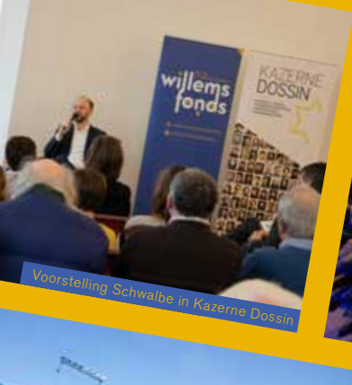
Voorstelling Schwalbe in Kazernie Dossin