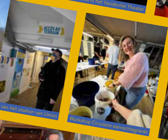
Workshop Circulaire aanrechtgranier