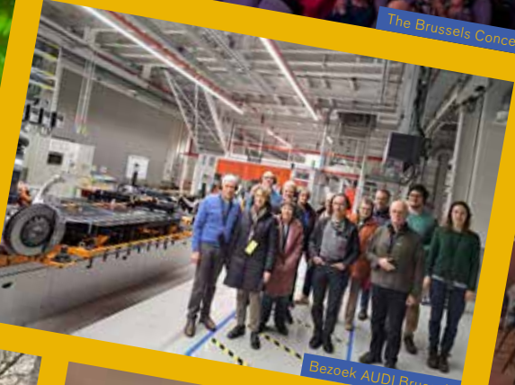
Bezoek AUDI Brussels