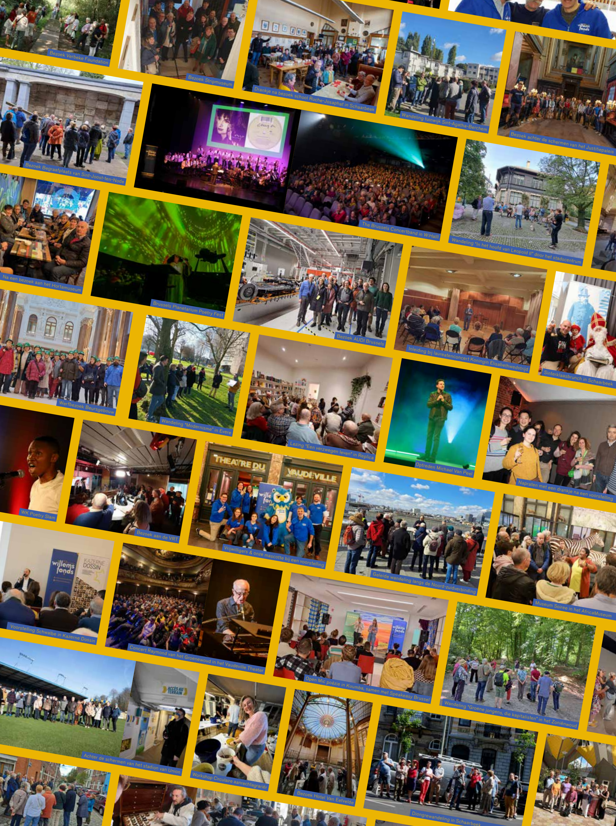
Bezoek Verbeke Foundation