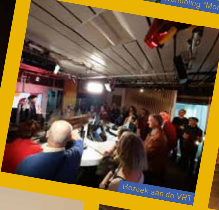
Bezoek aan de VRT