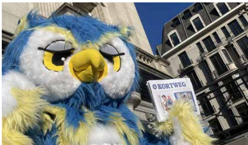
Al bijna een eeuw is de uil het symbool van het Willemsfonds. Onze Brusselse mascotte Bubo poseert hier met Kortweg.

In deze speciale mini-editie van ons magazine vind je alvast een voorsmaakje. Zo nodigen we je graag uit voor ons groot jazzconcert op 10 maart in W:Halll (Sint-Pieters-Woluwe) en vind je op de volgende pagina's nog meer informatie over onze activiteiten in de komende weken, onze boeken en onze vereniging.