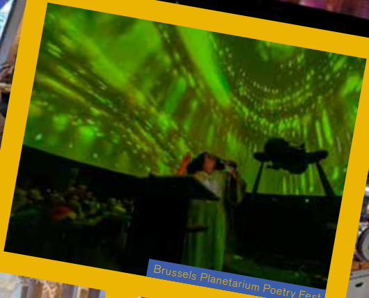
Brussels Planetarium Poetry Fest