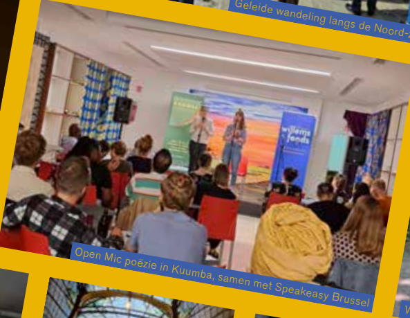
Open Mic poezie in Kuumba, samen met Speakeasy Brussel