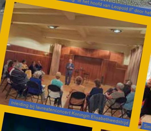
Inleiding bij laureatenconcert Koningin Elisabethwedstrijd