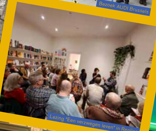
Lezing "Een verzwegen leven" in Replica