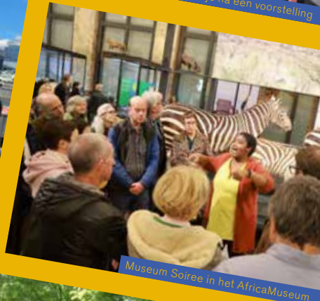
Museum Soiree in het AfricaMuseum