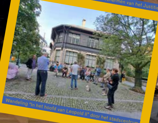
Wandeling "In het hoofd van Leopold II" door het stadscentrum