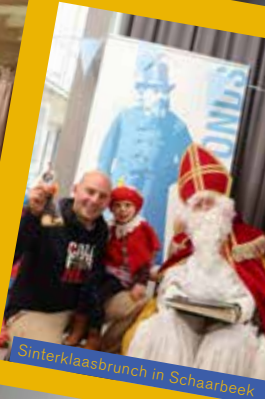
Sinterklaasbrunch in Schaarbeek