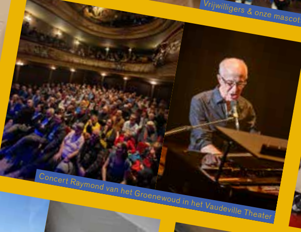
Concert Raymond van het Groenewoud in het Vaudeville Theater