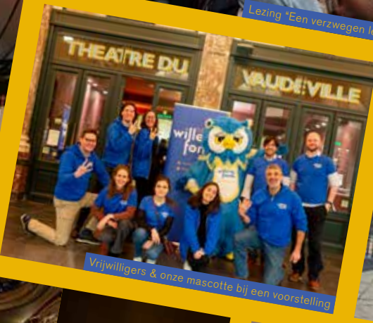
Vrijwilligers & onze mascotte bij een voorstelling