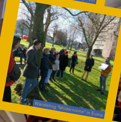
Wandeling "Modernisme" in Evere