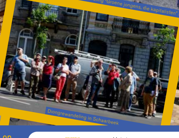
Diengrewandeling in Schaarbeek