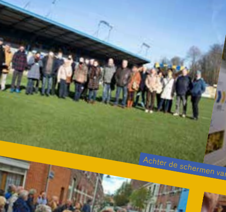
Achter de schermen van het stadion van Union