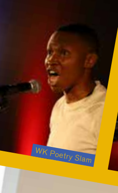
WK Poetry Slam