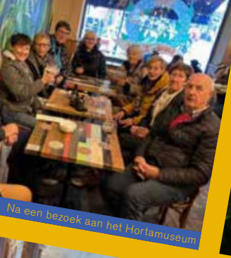
Na een bezoek aan het Hortamuseum