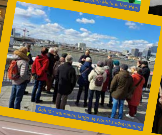
Geleide wandeling langs de Noord-zuidverbinding