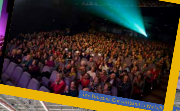
The Brussels Concertband in W-Hall