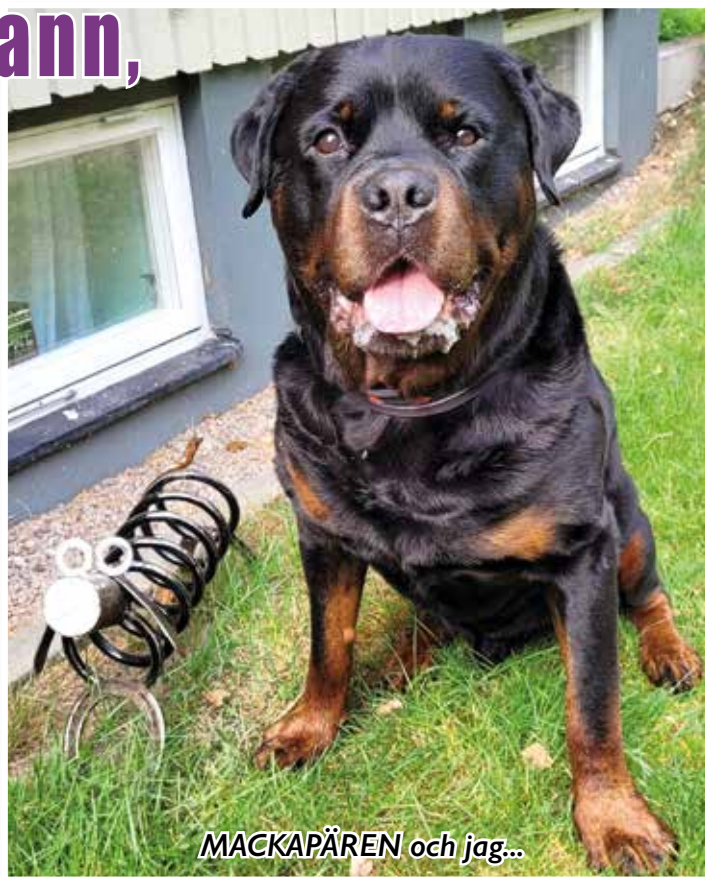
MACKAPÄREN och jag...

Som den fina hund jag är, emottog jag folkets hyllningar med grace och elegans. Matte blev lite sentimental och började prata om gamla tider, som äldre människor gör ibland. Men jag förstod ju hur stolt hon är över mig och hur roligt hon har haft i mitt sällskap. Och jag måste säga att jag är ganska nöjd med henne också. Vi har tränat och tävlat och gått långprome-