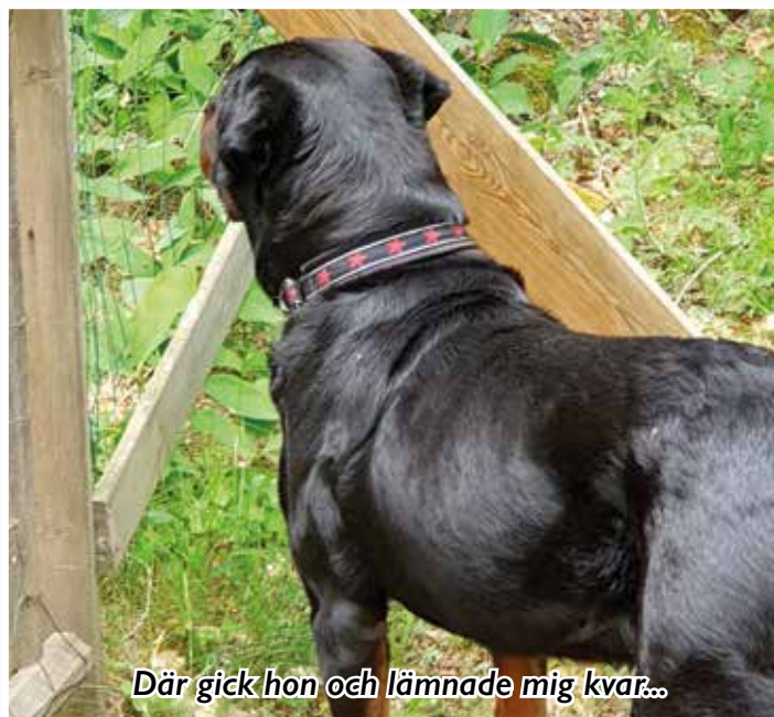
Där gick hon och lämnade mig kvar...