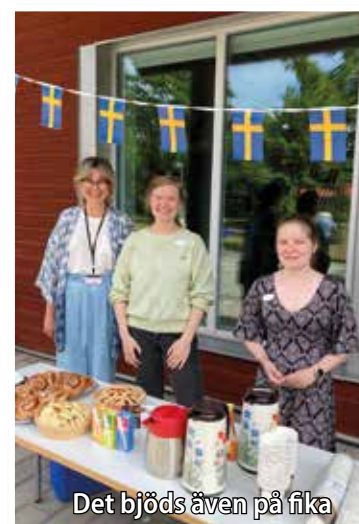
Det bjöds även på fika