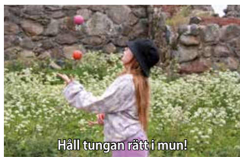
Håll tungan rätt i mun!