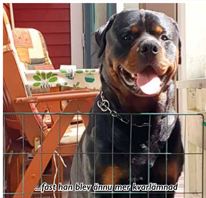
...fast han blev ännu mer kvarlämnad