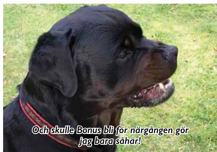
Oh skulle Bonus bli för närgången gör jag bara såhär!

glad att träffa lillkillen igen, dock inte lika oförblommerat lycklig som han blev.