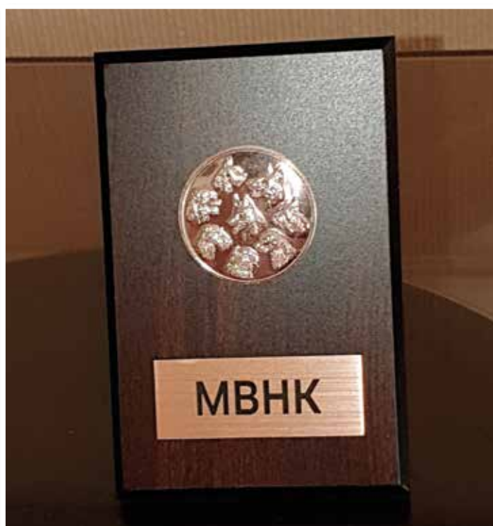
...och här är min fina medalj!