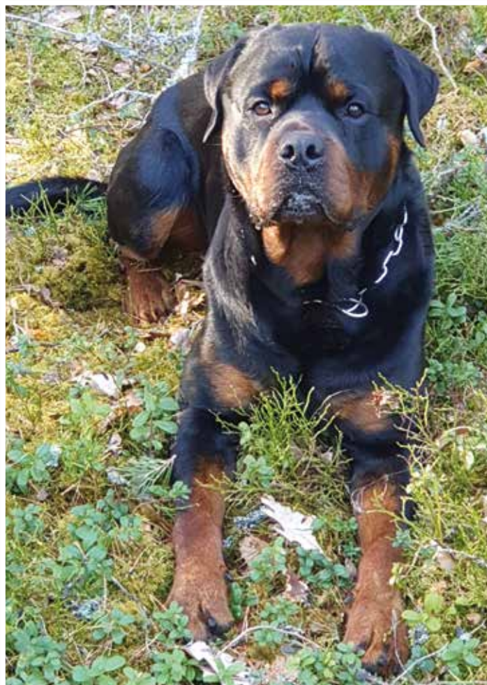
Här är jag...