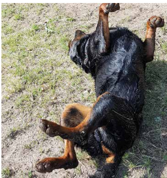
Så här glad blir jag efter spåret.