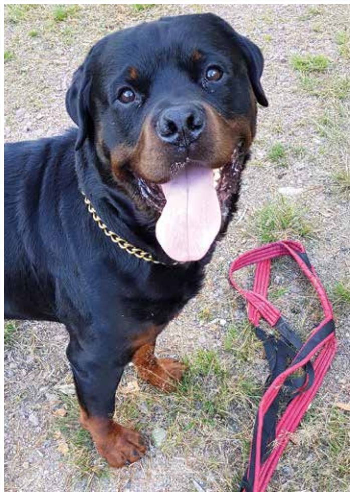
Selen kan faktiskt Bonus få.