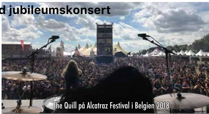
The Quill på Alcatraz Festival i Belgien 2018

Men som om inte detta var nog så anordnar kommunen en utställning i Mönsterås bibliotek – helt ägnad åt bandets långa karriär. Utställningen pågår mellan 23 maj och 11 juni och innehåller mängder av föremål från deras långa karriär. Bandet kommer även att göra en unik unplugged-konsert på biblioteket den 4 juni. Antalet platser är begränsade så det gäller att "hänga på låset" om man vill vara med om detta ovanliga event.